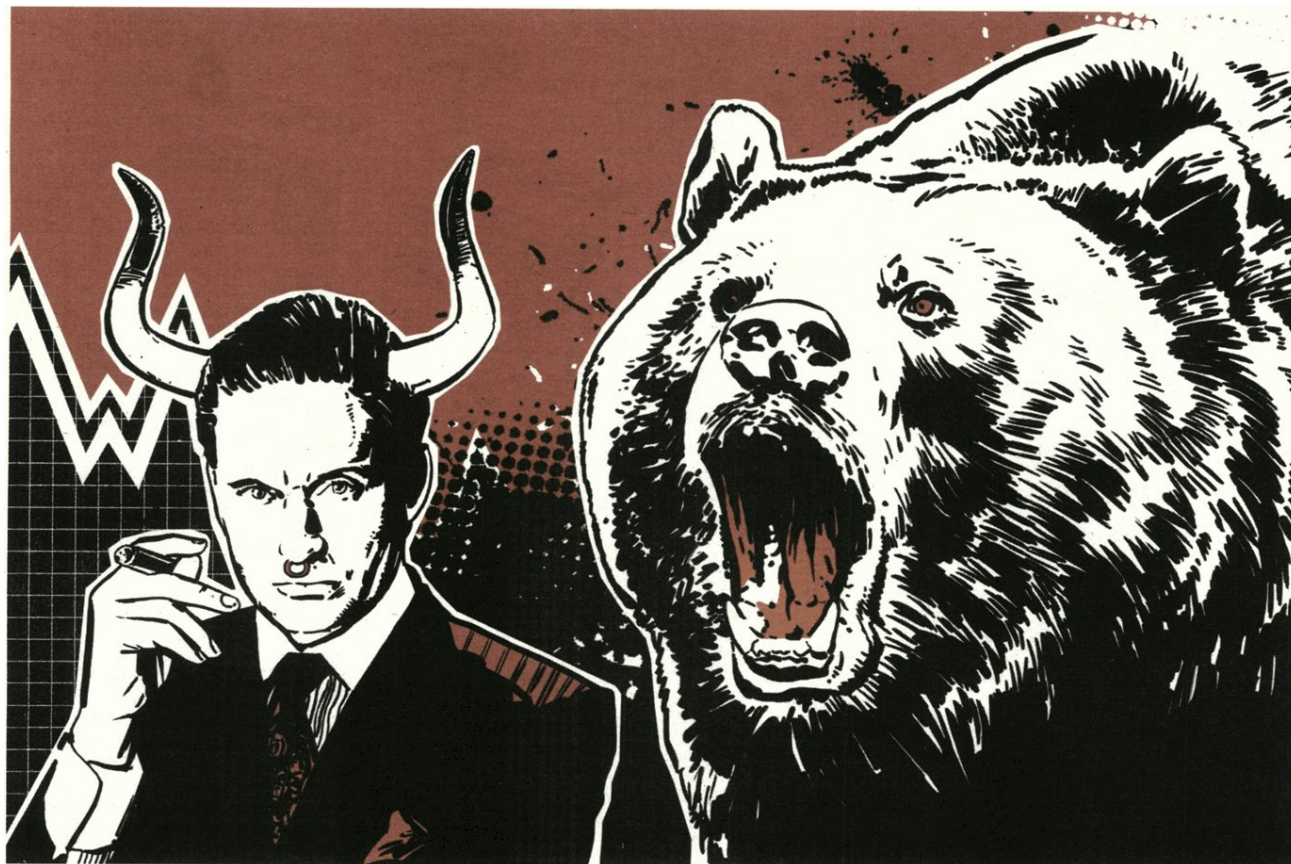
ILLUSTRATION: PM HOFFMANN